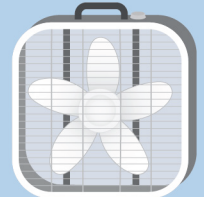
Ventilador de caja de 20" x 20"