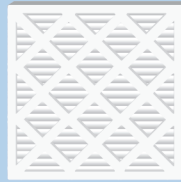
Filtro de aire de 20" x 20" (clasificación MERV de 13 puntos o más)